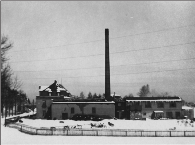
Das Firmengelände 1929