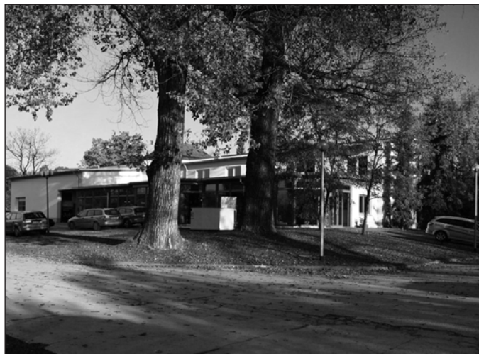
Die WERTEC GmbH 2008