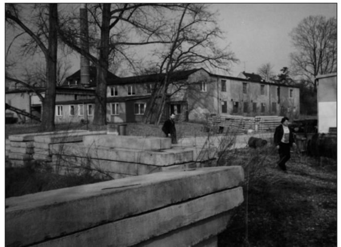
Der VEB Polar 1991