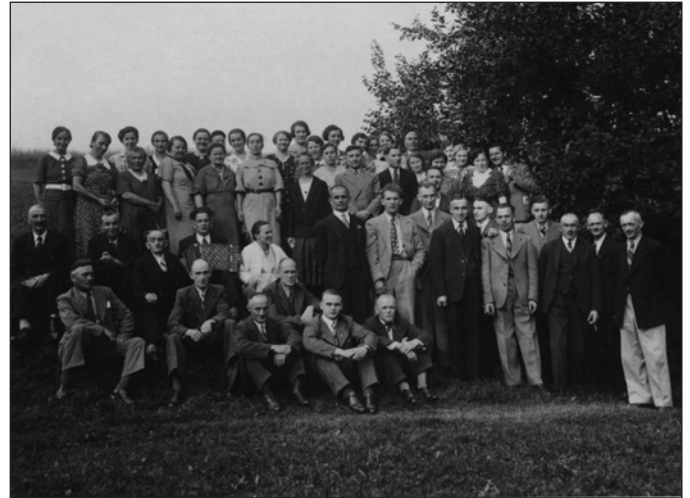
Die Belegschaft der Färberei in den 30iger Jahren

Hochdruckkessel durch neue Anlagen. Im gewohnten Rahmen konnte die sehr rentable Produktion bis 1972 fortgesetzt werden. Dann aber beschloss die Stadt arbeitsgruppe des Rates der Stadt Karl-Marx-Stadt am 24. April 1972 in der Entscheidungsvorlage zur Übernahme des Betriebes: „Der Betrieb wird mit Wirkung vom 1. Mai 1972 in das Volkseigentum übernommen.“